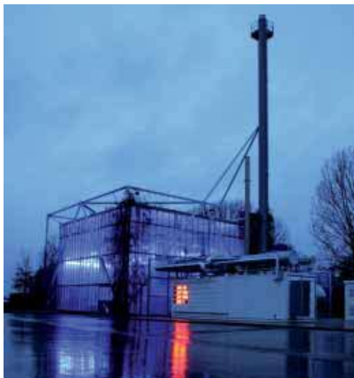
Energía renovable procedente de la central de calefacción por cogeneración

El centro de producción principal de Wilkhahn, así como todas las delegaciones de venta europeas están certificadas conforme a ISO 9001. En la selección de sus proveedores Wilkhahn valora en gran medida la existencia de un sistema amplio y funcional de gestión de calidad.