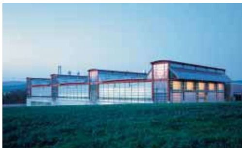
“Medio ambiente construido”, Bad Münders