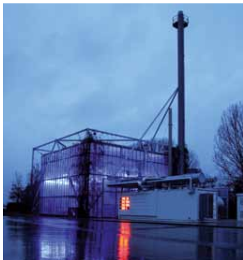
Energía renovable procedente de la central de calefacción por cogeneración

El centro de producción principal de Wilkhahn, así como todas las delegaciones de venta europeas están certificadas conforme a ISO 9001. En la selección de sus proveedores Wilkhahn valora en gran medida la existencia de un sistema amplio y funcional de gestión de calidad.