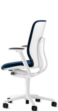
187/7 Drehstuhl, mittelhoher Rücken

Die Armlehnen lassen sich per Tastendruck um 100 mm in der Höhe anpassen. Optional sind die Armauflagen um 50 mm in der Tiefe und je 25 mm in der Breite verschiebbar (3-D-Funktion) und zusätzlich um 25° nach außen oder innen drehbar (4-D-Funktion).