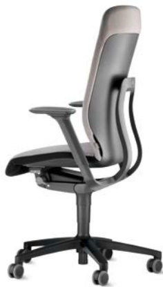
187/8 Drehstuhl, hoher Rücken