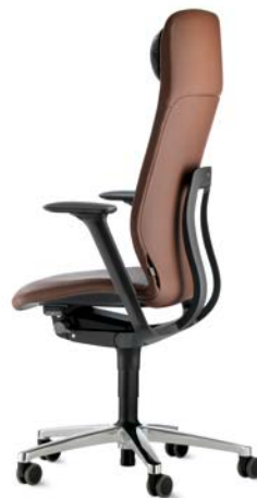
187/9 Drehstuhl, hoher Rücken mit Kopfstütze und Nackenkissen