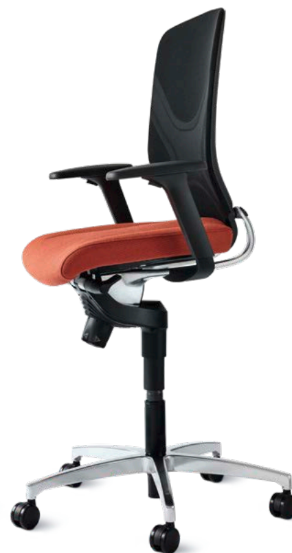
IN-Drehstuhl 184/72 Mittelhoher Rücken Erhöhte Sitzposition (ESP)