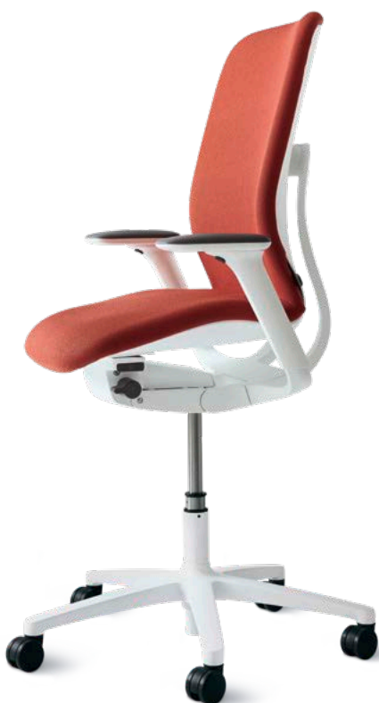
AT-Drehstuhl 187/72 Mittelhoher Rücken Erhöhte Sitzposition (ESP)

Genau hier setzen die Free-to-move-Modelle mit erhöhter Sitzposition (ESP) an: Sie lassen sich als Bürostühle mit voller 3-D-Beweglichkeit an einer normalen Tischhöhe nutzen, aber auch auf über 60 cm Sitzhöhe hochfahren.