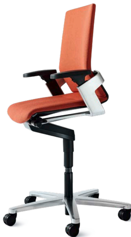
ON®-Drehstuhl 174/72 Mittelhoher Rücken Erhöhte Sitzposition (ESP)