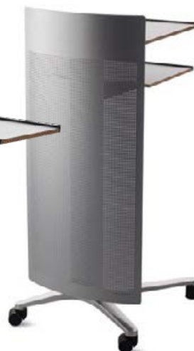
Pupitre de conférencier Modèle 448 / 9