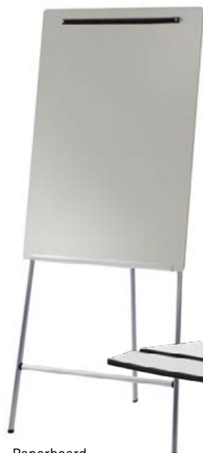
Paperboard Modèle 442 / 1