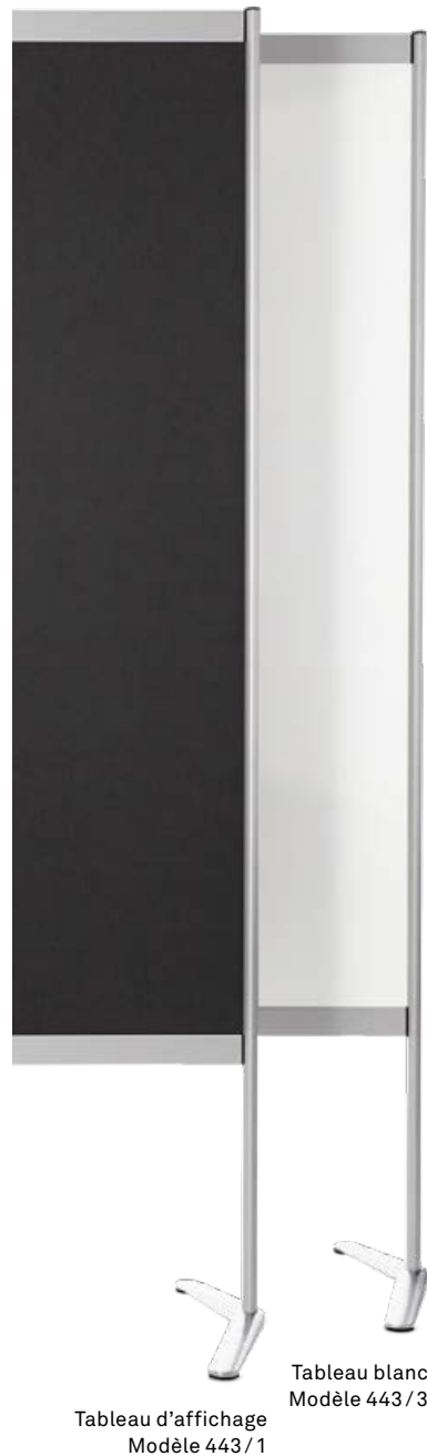
Tableau d'affichage Modèle 443 / 1