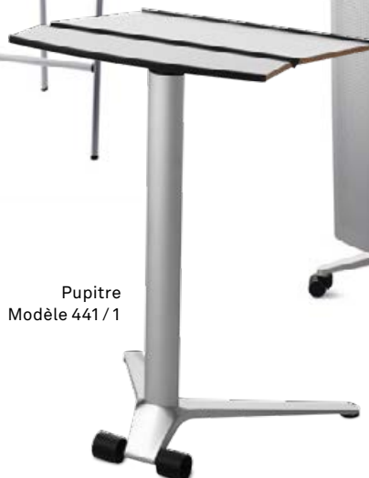
Pupitre Modèle 441 / 1