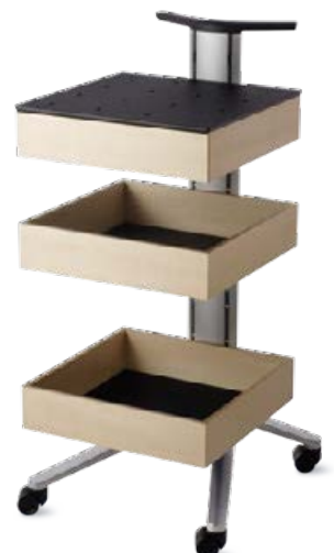
Dessertes Modèle 446 / 3

La gamme Confair incarne à merveille le mariage de l'innovation et de l'image : le soin apporté au détail, la noblesse des matériaux et un design inimitable sont aussi motivants que valorisants et favorisent l'esprit d'équipe.