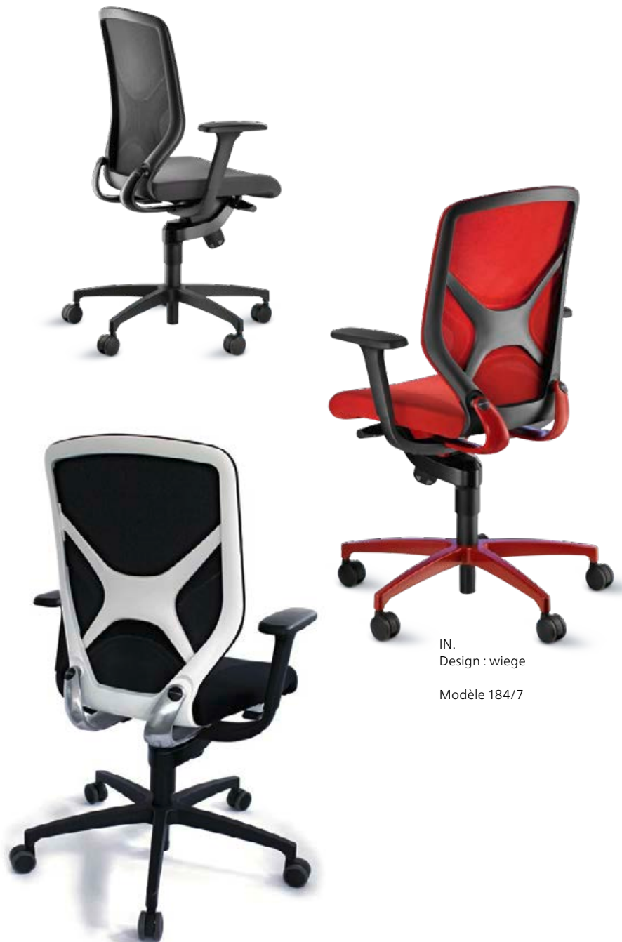
IN. Design : wiege Modèle 184/7

Le nouveau siège de travail IN décline désormais ce concept dans le milieu de gamme. Plus simple, plus compacte et encore plus dynamique, la gamme IN propose une alliance sans précédent entre cinématique tridimensionnelle, contact permanent, bien-être et agrément d'utilisation. Grâce à leur synchronisation très aboutie, l'assise et le dossier accompagnent au millimètre chaque changement de posture de l'utilisateur. IN brille tant par ses qualités fonctionnelles que par un design innovant, qui exprime d'emblée le dynamisme de la gamme. Avec son élégance agrémentée d'une touche sportive et ses arceaux caractéristiques aux galbes travaillés, IN fait preuve d'une personnalité aussi valorisante qu'affirmée, mais dépourvue de toute ostentation.