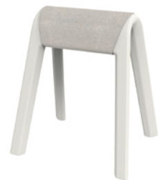
204/02 Sitzbock con almohadilla de fieltro