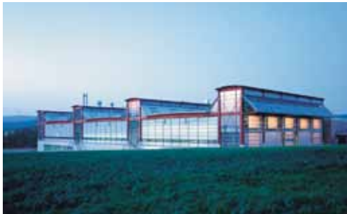
Bad Münde „Gebaute Umwelt“