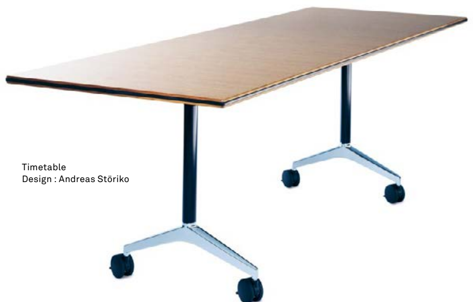
Timetable Design : Andreas Störiko